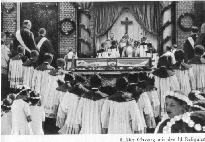
8. Der Glassarg mit den hl. Reliquien.

W 1960 roku decyzją władz kościelnych dokonano otwarcia grobowca znajdującego się za ołtarzem głównym świątyni w St. Wendel. Szczątki świętego umieszczone zostały tutaj w 1338, po przeniesieniu z opactwa w Tholey. Kości okazały się bardzo dobrze zachowane, wskazują, że należą do człowieka wysokiego wzrostu, 185 cm. Po wykonaniu dokumentacji, pobraniu relikwii i poświęceniu wróciły na