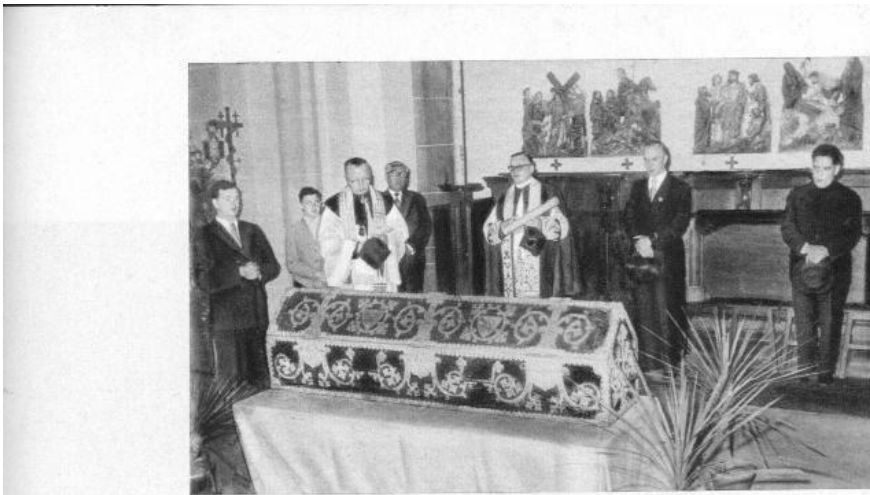
7. Die geschlossene Lade des hl. Wendelin.