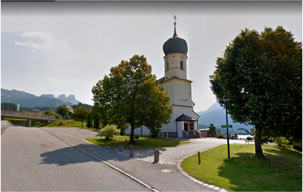
kościół pw. św. Wendelina w Grän, Tyrol, Austria