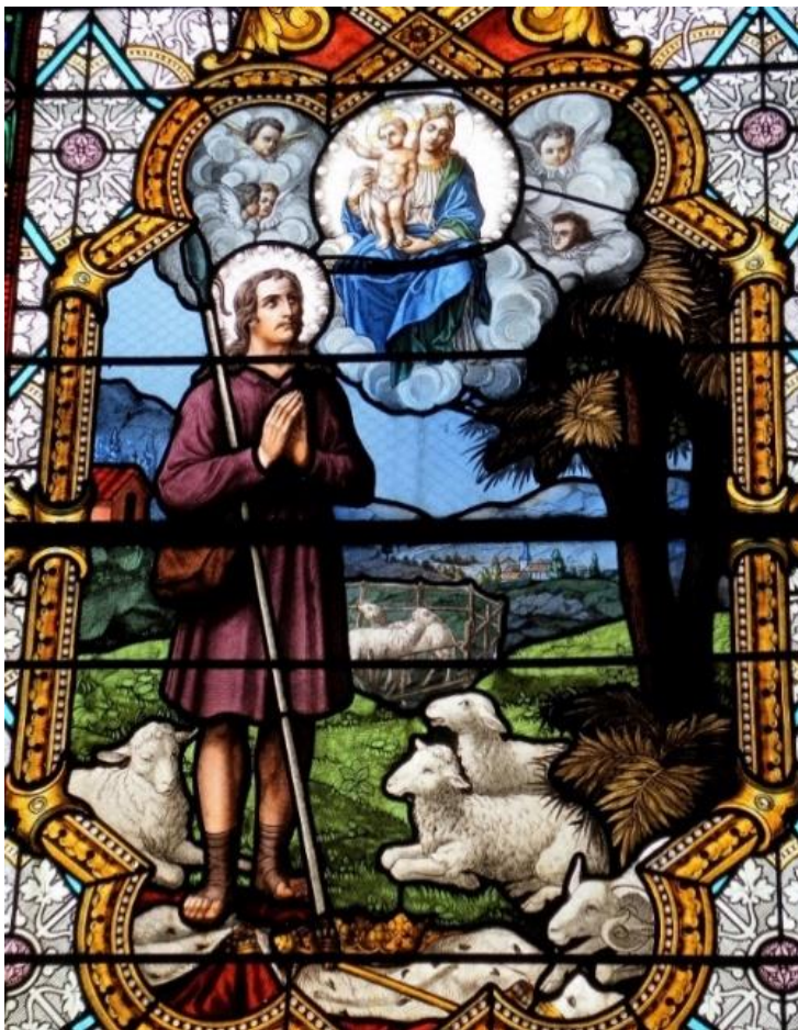
Najpiękniejszy wizerunek św. Wendelina, witraż w Chapelle Notre-Dame, Moselle, Francja