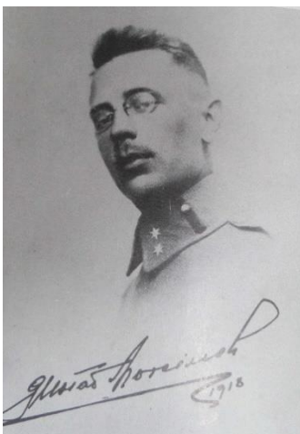
Gustaw Morcinek (1891-1963) , pisarz, publicysta, nauczyciel, poseł na Sejm.

Gustaw Morcinek urodził się 25 sierpnia 1891 roku w Karwinie na Zaolziu. Po ukończeniu szkoły ludowej, w wieku 16 lat rozpoczął pracę w kopalni jako górnik. W wieku 19 lat podjął naukę w polskim seminarium nauczycielskim w Białej, otrzymując kwalifikacje do nauczania w szkołach z polskim językiem wykładowym.